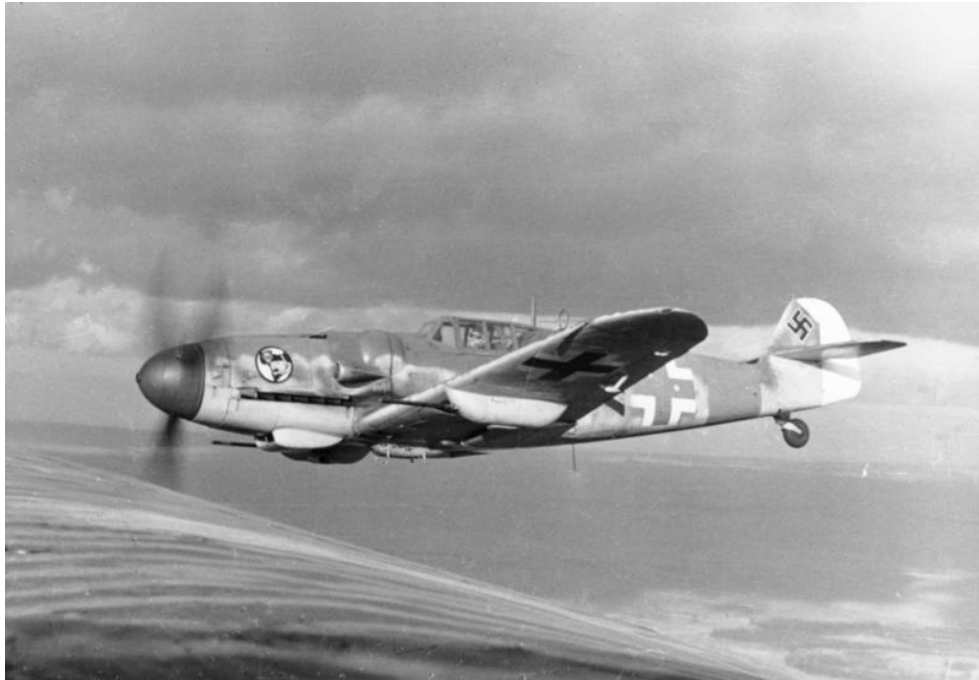
Een Messerschmitt Bf 109