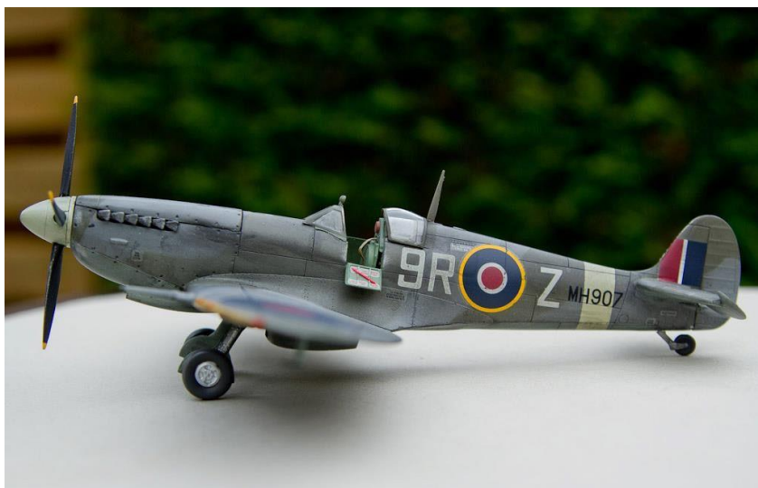
Schaalmodel Spitfire