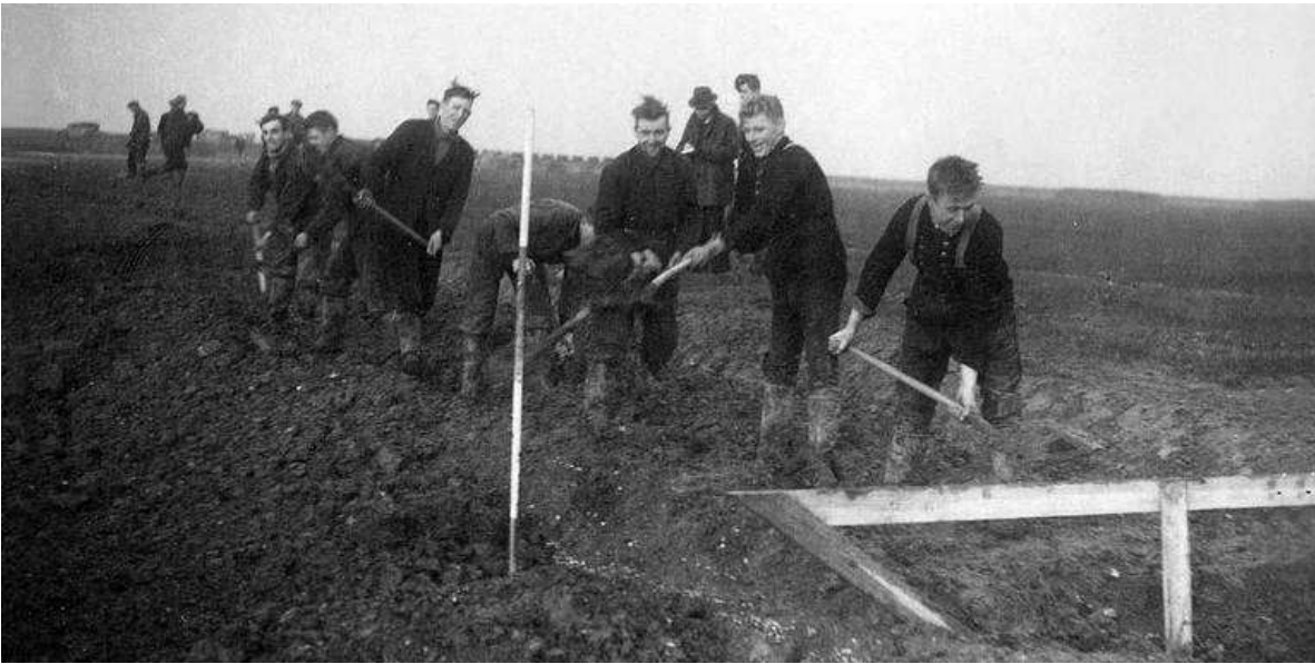
Het uitzetten en graven van de eerste sloten in de polder. De jongemannen op de foto kwamen uit Staphorst.

Dertig tot veertig man mochten in deze dorpen in totaal 400 hectare land verdelen. Om te pachten. Er waren geen huizen bij. De mannen woonden vaak nog gewoon op het Bildt. Sommigen sliepen in de oude werkkampen uit de oorlog die nog in de polder stonden.