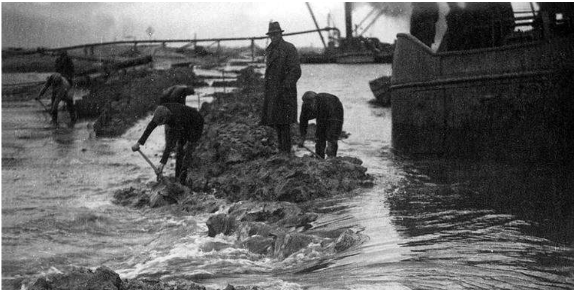
De sluiting van het Zwolsediep bij Vollenhove.

De hele Noordoostpolder was opgedeeld in letters en cijfers. Evert de Boer bezit kavel R11. Onder Lemmer begint het A-gebied, bij Vollenhove eindigen de kavels (met de letter T).