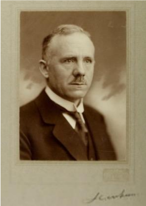
Henri ter Veen (tussen 1930 en 1949); vervaardiger: Zimmerman (Universiteit van Amsterdam/collectie Universiteitsgeschiedenis). 15

Een medestudent van Hermans keek in 1995 terug: "Je moet bedenken dat de sociale geografie een vak was dat zich werkelijk met alles bemoeide. Van volkenkunde tot mineralogie, je kon het zo gek niet verzinnen of het werd tot de sociale geografie gerekend." 16 Voor die brede aanpak was vooral Ter Veen verantwoordelijk. Otterspeer: "Onder zijn leiding ontplooidde de Amsterdamse sociografie zich als een school waar op een breed terrein onderzoek gedaan werd, zowel op het gebied van de beschrijving van geografische eenheden (steden, regio's, dorpen) en beroepen (allerlei vormen van nering en organisatie, industrialisatie en moderniseringsprocessen." Ook buiten de universiteit was Ter Veen actief. De oprichting van de Zuiderzeestichting, voor onderzoek naar de bevolking van de drooggelegde Zuiderzeepolders, was slechts één van zijn initiatieven. 17