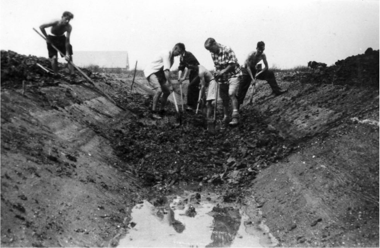
Onderduikers bezig met het graven van een tocht, omgeving Marknesse (Nieuw Land Erfgoedcentrum (GA Noordoostpolder), 1943;). 25

Van de 14.600 studenten die aan Nederlandse universiteiten stonden ingeschreven, hebben er iets meer dan 2000 de verklaring getekend. 26 Heel wat van de weigeraars kwamen naar de NOP; het 'Nederlands Onderduikers Paradijs'. 27 Hermans kwam ook naar de NOP, maar niet om, zoals zij, tewerkstelling in Duitsland te ontlopen; hij kwam 'op excursie'. Zijn hele leven heeft hij volgehouden de loyaliteitsverklaring voor studenten nooit te hebben ondertekend. Hij vertelde er niet bij dat dat ook niet hoefde, omdat hij als assistent op de universiteit al de ambtenarenverklaring had getekend, die daar vrijwel woordelijk mee overeenkwam. 28