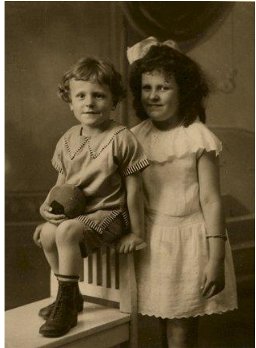
WFH met zusje 9

Over twee boekjes die hij in 1934 leende, kon hij tientallen jaren later nog steeds lyrisch worden: een geologieboekje voor beginnende amateurs en een boekje over stenen verzamelen. Hij begon in zijn pubertijd zelf stenen te zoeken, vooral tijdens vakanties op de Veluwe en in Limburg. De dode natuur vond hij honderd keer interessanter dan de bloemetjes en plantjes waar zijn moeder en zus op uit waren. 8